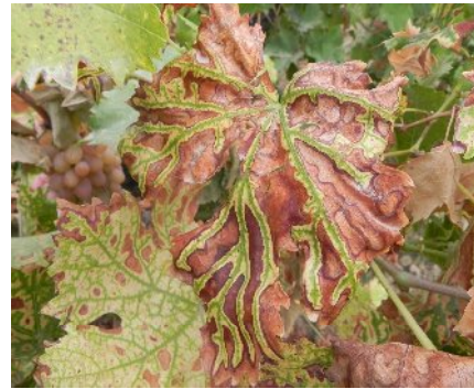
شکل ۱- علائم شاخص بیماری اسکای مو