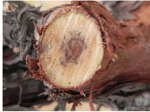
شکل ۶- راست: مقطع طولی تنه اصلی انگور و مشاهده نوار قهوه ای رنگ، چپ: مقطع عرضی سرشاخه انگور و نقاط تیره و روشن پوسیدگی قهوه ای