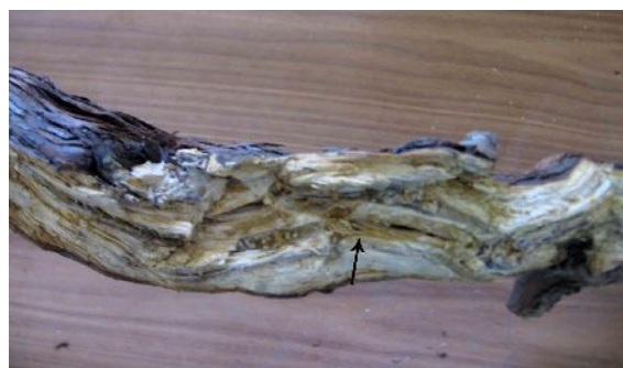
شکل ۵- برش طولی تنه اصلی انگور مبتلا به پوسیدگی سفید