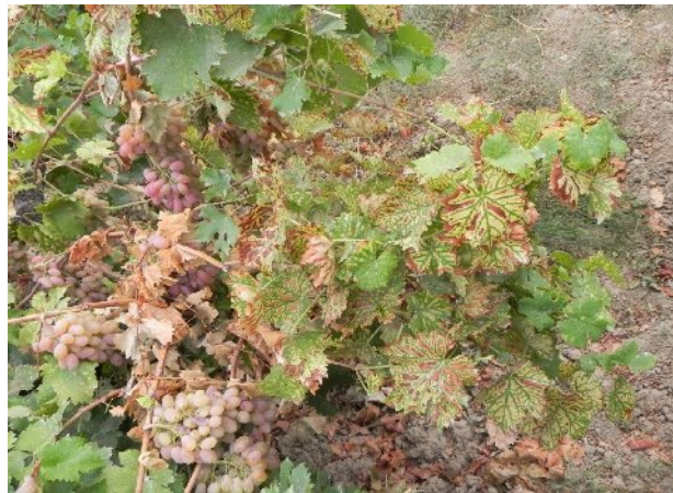
شکل ۲- علائم پوست ببری برگهای آلوده به بیماری اسکا