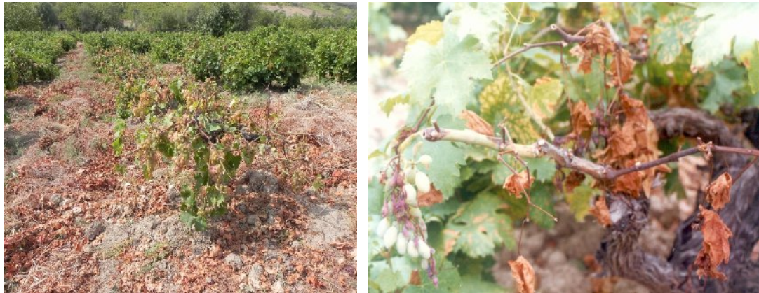
شکل ۷- مرگ ناگهانی انگور یا آپوپلکسی

می‌شوند (شکل ۷). سکتته در تابستان های گرم رخ می دهد به ویژه زمانی که بارندگی با خشکی هوای گرم ادامه یابد. این موضوع می تواند با افزایش سریع غلظت و فعالیت متابولیت های سمی در زمان تعرق مرتبط باشد.