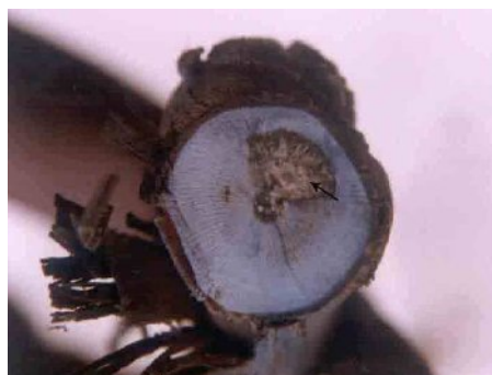
شکل ۴- مقطع عرضی تنه مبتلا به اسکا (پوسیدگی سفید در مرکز و پوسیدگی قهوه ای در اطراف)